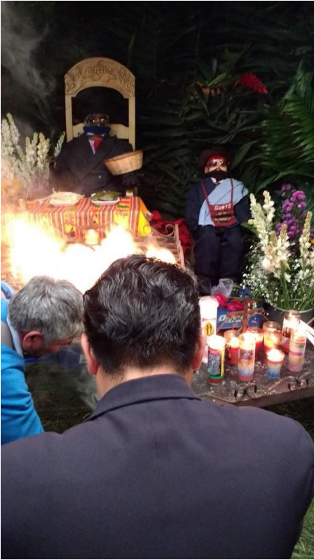
Centro Espiritual de Chiquilajá