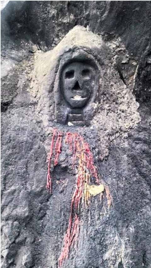
Centro Ceremonial en Zunil.