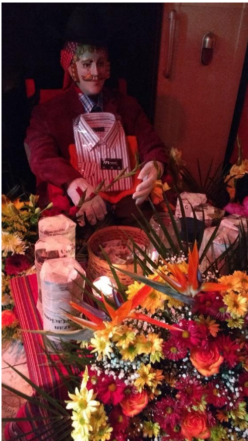
Centro Espiritual “Estrella Dorada” Pasac I