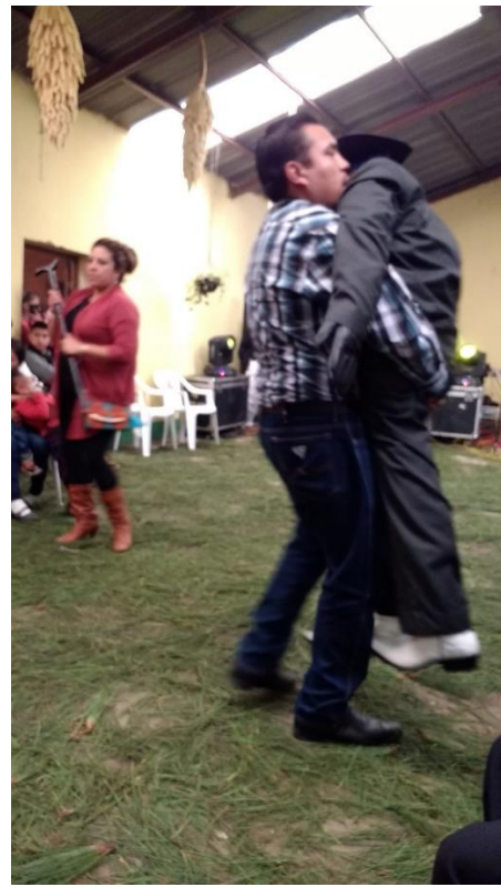
Baile ceremonial con San Simón Chiquilajá, Quetzaltenango.