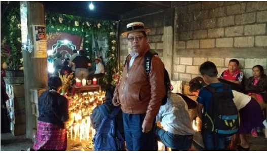
Capilla de la cofradía de Zunil.