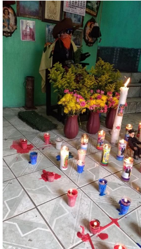
Capilla privada de la Aldea Chuisuc Cantel