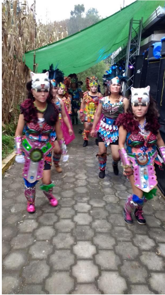
Fiesta en su honor San Simón Aldea Chuisuc Cantel del 28 de octubre 2018.