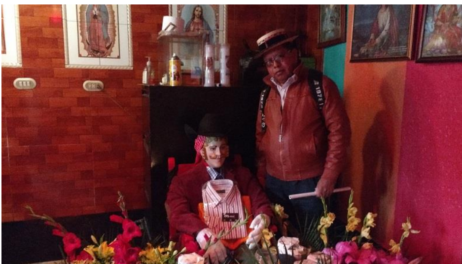
Imagen de San Simón “Estrella Dorada” Pasac I Cantel.