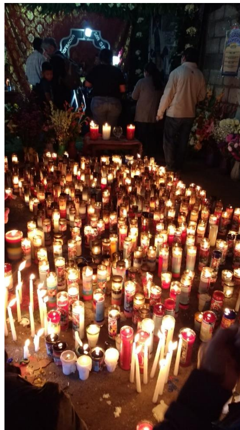
Capilla de la cofradía de Zunil Quetzaltenango.