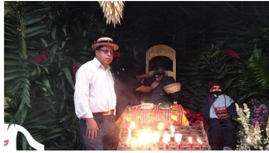
Capilla privada de San José Chiquilajá Quetzaltenango.