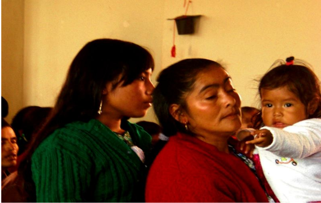
Fotografía, trabajo de Campo 2011.

El proceso migratorio hacia Estados Unidos ha generado un ambiente dominado por las mujeres en Cabricán, los hombres en su mayoría han migrado.