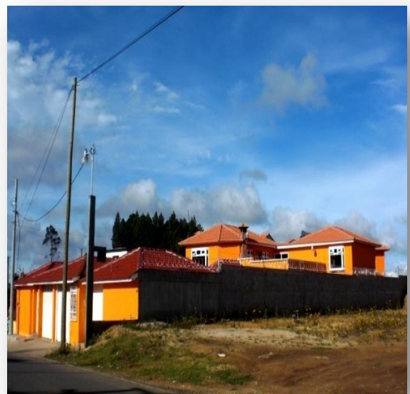
Fotografías tomadas durante el trabajo de campo 2011.

En esta serie de fotografías se verifica del lado izquierdo el patrón tradicional de construcción y estilo de viviendas mientras que en el lado derecho se presentan nuevas construcciones que dan cuenta de los imaginarios de éxito y superación que la migración implica para el migrante y sus familiares.