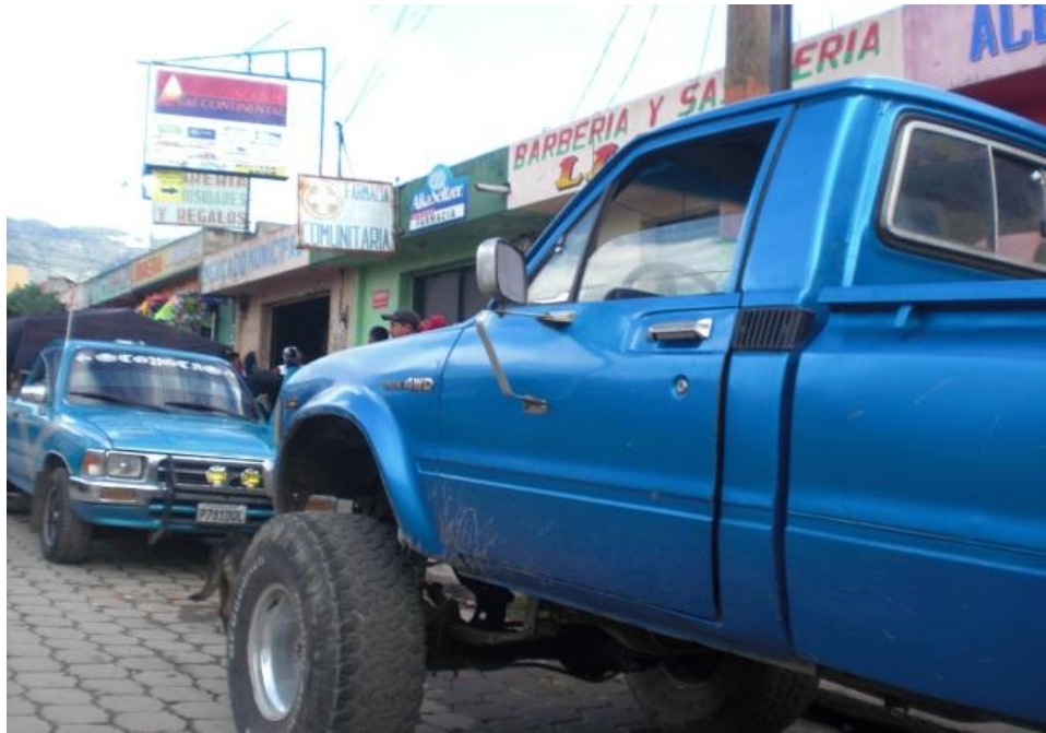
Fotografía trabajo de campo 2010.