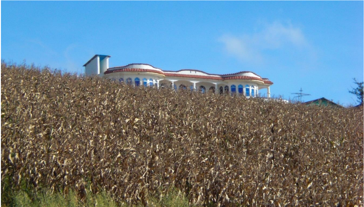
Trabajo de campo 2,010.

En las fotografías se presenta el entorno tradicional de las comunidades en Cabricán, esta vista dista de las nuevas edificaciones y la reconfiguración visual que se vive como fruto del uso de remesas en la construcción de casas en la zona.