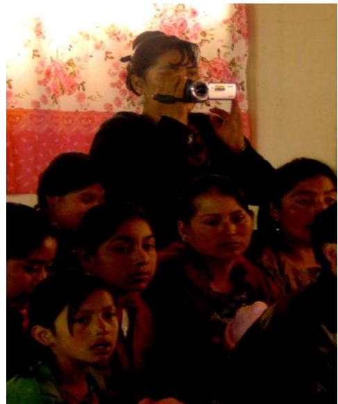
Fotografías: trabajo de campo 2011 misa en el salón parroquial de Cabricán 12/10/10.