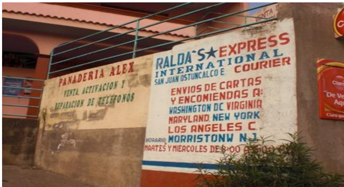
Trabajo de Campo 2011.