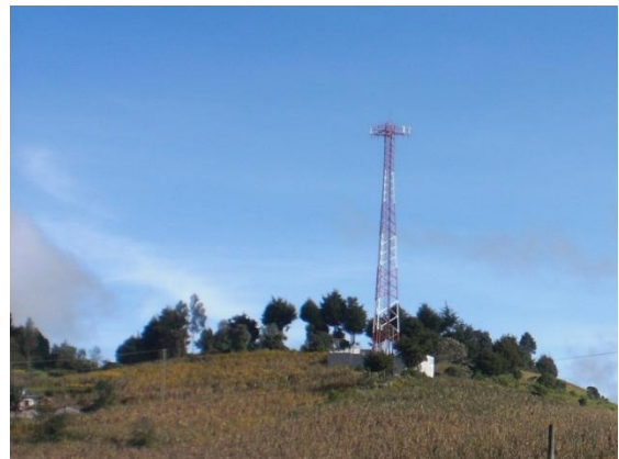
Proliferación de antenas de comunicación.