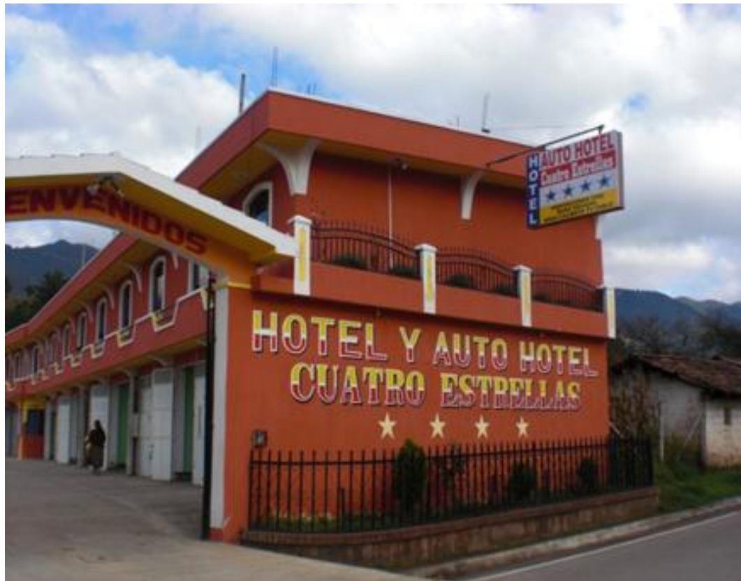
Fotografías trabajo de campo 2,010.

El fenómeno migratorio también ha impulsado el aparecimiento de nuevas empresas de transporte de mensajería y encomiendas.