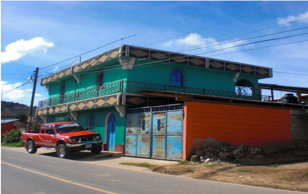
Fotografías trabajo de campo 2011.