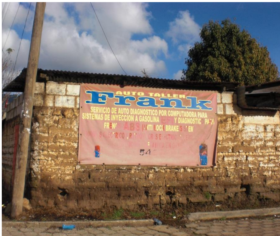
Fotografía trabajo de campo 2010.